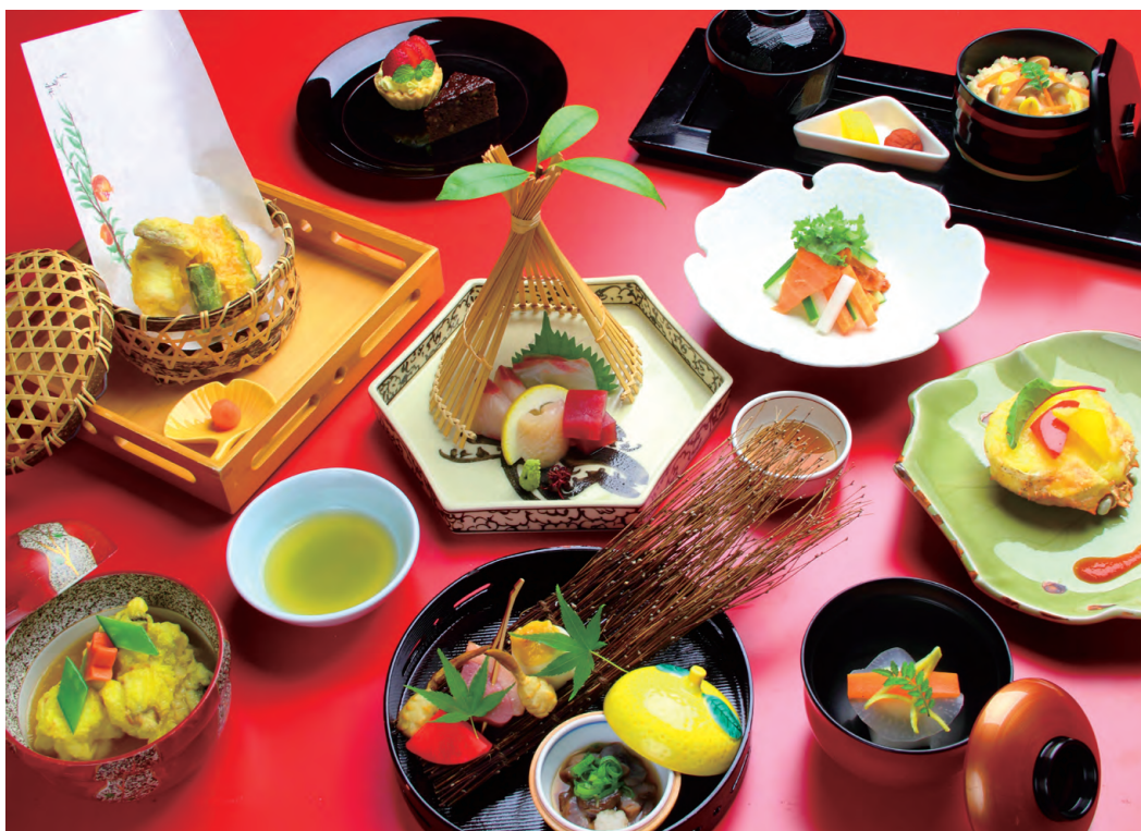
※季節によりお料理の内容・器等は変更になる場合がございます。 写真は一例です